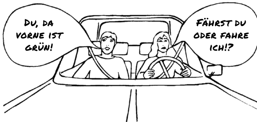
Abb. 4.04: Beispiel einer sozialen Situation mit Verständigungsbedarf (nach Schulz von Thun 1981) 3

Nehmen wir zur Veranschaulichung ein Beispiel aus dem Buch „Miteinander reden“ (Schulz von Thun 1981): Die soziale Situation zeigt ein Paar beim Autofahren. Thema ist hier der Fahrstil. Hypothetische Handlungsziele: Schneller vorankommen aber auch Besserwisserei. Zeitliche, räumliche, soziale Randbedingungen: Eile, Kreuzung, Ampel, Paarbeziehung. Situationsdefinition des Mannes: „Du passt nicht auf!“ Situationsdefinition der Frau: „Du sollst mir nicht reinreden“. Es liegt also ein Konflikt vor, möglicherweise auch ein Verständigungsbedarf. (Es kann aber auch sein, dass dieser Wortwechsel zwischen den beiden zu einem „Ritual“ erstarrt ist, über das eine Verständigung kaum noch möglich ist oder nicht mehr gewünscht wird!)