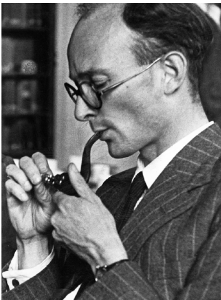
Abb. 4.01: John Langshaw Austin (1911 – 1960) 1

In der 2. Vorlesung habe ich Ihnen die Gebrauchstheorie der Bedeutung vorgestellt: Mit seiner These „Das Sprechen der Sprache (ist) ein Teil einer Tätigkeit.“ nahm Wittgenstein die Sprechakttheorie vorweg, die der englische Philosoph John Langshaw Austin in seinem Buch „How to do Things with Words“ ( Austin 1962, deutsch 1986 ) begründet hat.