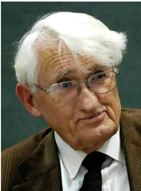
Abb. 4.02: Jürgen Habermas (* 1929) 2

Auf diesen sprachphilosophisch-linguistischen Grundlagen aufbauend formulierte der Soziologe und Philosoph Jürgen Habermas ( geb. 1929 ) eine umfassende Handlungstheorie der Kommunikation, die uns als nächstes beschäftigen soll. Habermas gilt als bedeutendster lebender deutscher Sozialphilosoph. Er steht in der Tradition der Kritischen Theorie der „Frankfurter Schule“ ( Theodor W. Adorno, Max Horkheimer, Erich Fromm und andere). Gleichzeitig hat er sich als „öffentlicher Intellektueller“ mit seinen Veröffentlichungen an fast allen wichtigen gesellschaftlichen Debatten seit den 60er Jahren des vorigen Jahrhunderts bis hin zum Ukrainekrieg und der Gefahr eines Atomschlages beteiligt. Er hat sich für ein demokratisches Deutschland und Europa eingesetzt und das intellektuelle Klima der Bundesrepublik mitgeprägt.