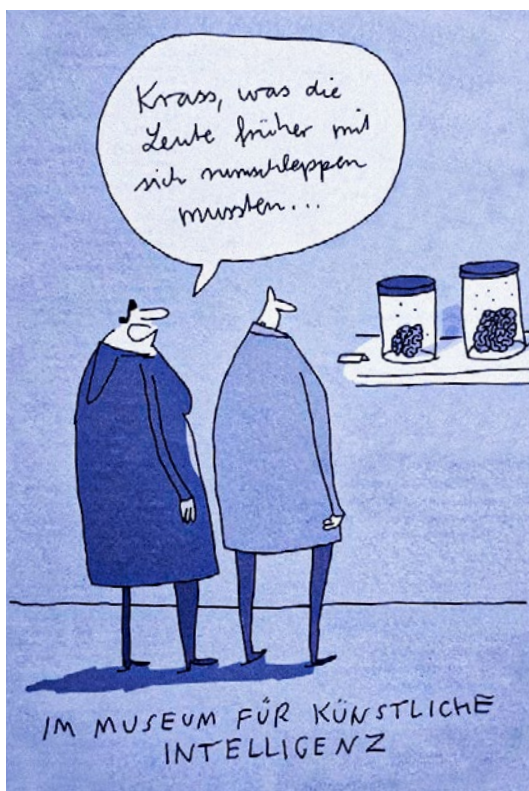
Abb. 3.02: Zukunft der KI 2

Die Autoren heben hervor, die Stärke menschliche Intelligenz sei es, aus relativ kleinen Datenmengen Erklärungen abzuleiten. Nur so gelingt es, zwischen richtig und falsch zu unterscheiden. Im Gegensatz dazu leiten die Großen Sprachmodelle aus riesigen Datenmenge aufgrund rein statistischer Mustererkennung ihre Antworten ab. Es handelt sich um gigantische Plagiatsmaschinen, oder, wie Linguisten sie nennen, stochastische Papageien. Die Antworten der Chatbots haben deshalb nichts mit Intelligenz zu tun: