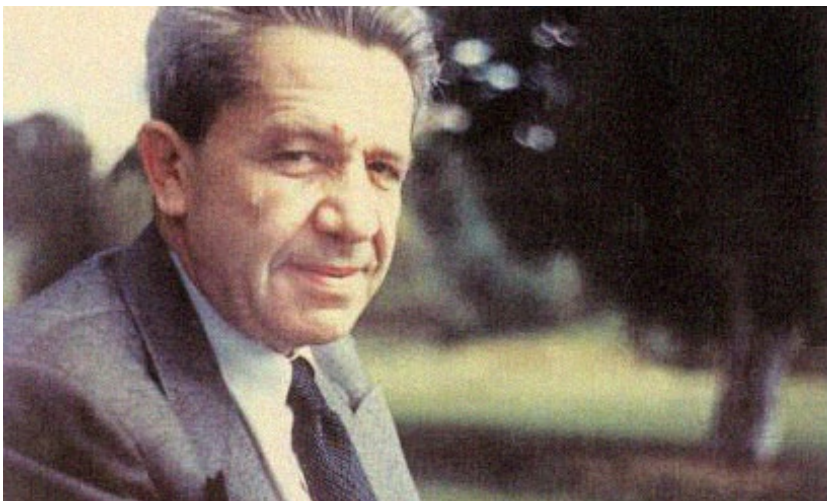
Abb. 3.03: Alfred Schütz (1899-1959) 4

Der Soziologe Alfred Schütz (1899-1959) hat den phänomenologischen Lebensweltbegriff Husserls für eine theoretische Grundlegung der Sozialwissenschaften nutzbar gemacht. Seine wissenschaftliche Karriere war ungewöhnlich. Er studierte in Wien Rechtswissenschaft, Ökonomie und Philosophie und arbeitete zeitlebens als Bankier. Sein umfangreiches philosophisches und soziologisches Werk, das in seiner Bedeutung erst nach seinem Tode erkannt wurde, schuf er neben dem Beruf. Als Jude emigrierte er 1938 in die USA, wo er Ende seines Lebens an der berühmten New Yorker New School auch zu akademischen Ehren kam.