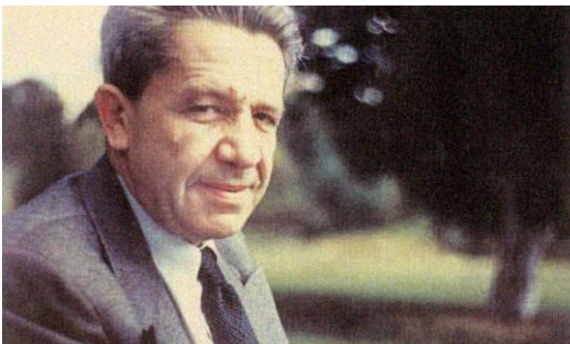
Abb. 3.03: Alfred Schütz (1899-1959) 3

Der Soziologe Alfred Schütz (1899-1959) hat den phänomenologischen Lebensweltbegriff Husserls für eine theoretische Grundlegung der Sozialwissenschaften nutzbar gemacht. Seine wissenschaftliche Karriere war ungewöhnlich. Er studierte in Wien Rechtswissenschaft, Ökonomie und Philosophie und arbeitete zeitlebens als Bankier. Sein umfangreiches philosophisches und soziologisches Werk, das in seiner Bedeutung erst nach seinem Tode erkannt wurde, schuf er neben dem Beruf. Als Jude emigrierte er 1938 in die USA, wo er Ende seines Lebens an der berühmten New Yorker New School auch zu akademischen Ehren kam.