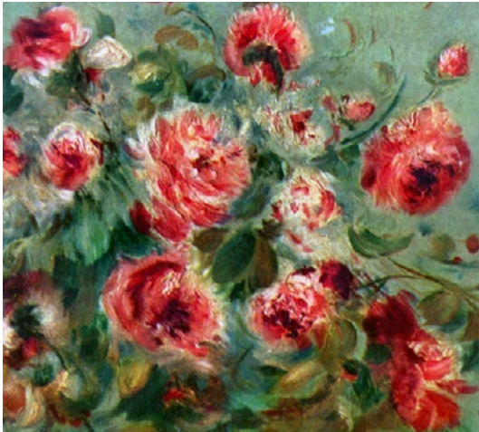
Abb. 3.01: Rosen von Vargemont - Ausschnitt (Auguste Renoir 1885) 1

Qualia sind innerhalb des naturwissenschaftlichen Weltbildes Fremdkörper. Schon 1882 erklärte der Berliner Physiologe und Begründer der experimentellen Elektrophysiologie Emil du Bois-Reymond (1818-1896) in seinem Vortrag Über die Grenzen des Naturerkennens die Bewusstseinsqualitäten zu einem ungelösten Welträtsel: